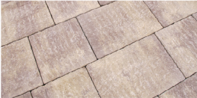
Serena Alt Terrassenplatten Farbe: terracotta nuanciert