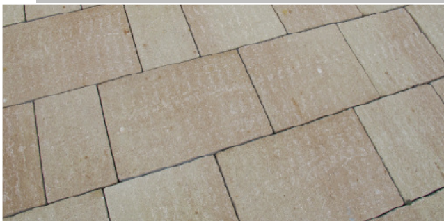
Serena Alt Terrassenplatten Farbe: sahara nuanciert