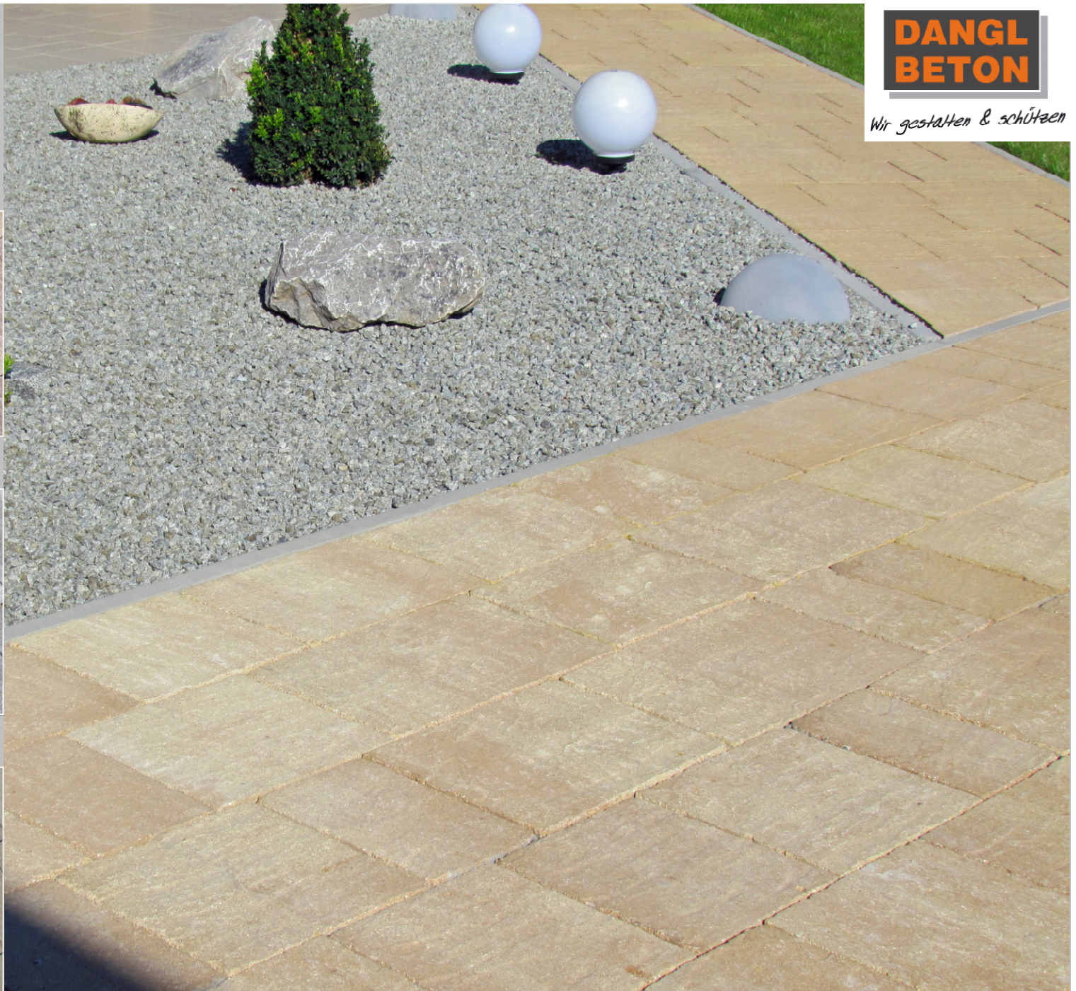
Serena Alt Terrassenplatten Farbe: sahara nuanciert